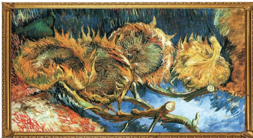
İLL 6. Vinsent Van Qoq “Kəsilmiş dörd günəbaxan”

Dərslərdə həmçinin özünəməxsus parlaq yaradıcılıq üslubu ilə seçilən Vinsent Van Qoqun rəngkarlıqda öz fərdi tərzini haqqında da geniş məlumatlar verilmişdir. Van Qoqun yaradıcılığı Avropa mədəniyyəti tarixində mürəkkəb keçid dövrünü əks etdirir. Onun yaradıcılığı həyata, sadə, zəhmətkeş insana alovlu, çılğın məhəbbətlə doludur. Van Qoqun əsərlərindəki özünəməxsus yaradıcılıq ehtirası, onun ani ifadə qüvvəti və faciəvi coşğunluğu şagirdlərdə maraqlı oyadır (VIII sinif təsviri incəsənət metodik vəsait, 2015: 96).