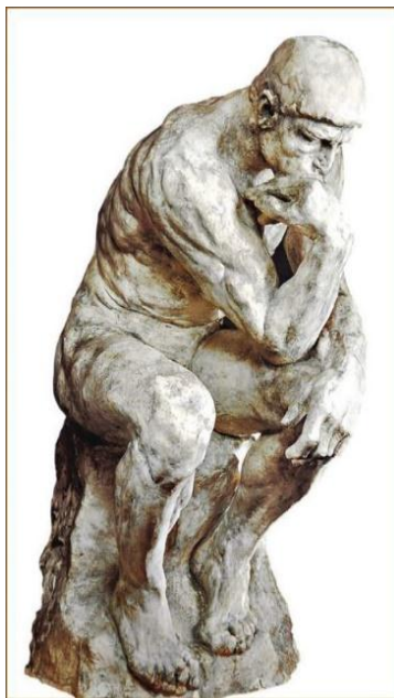
İLL 5. Ogüst Roden “Mütəfəkkir”

“Ogüst Roden: heykəltəraşlıqda hərəkət və emosiya” mövzusunda Rodenin əsərlərində bilərəkdən natamamlığa yol verməsi onun haqqında impressionist texnikasını heykəltəraşlıqda tətbiq etmiş ilk sənətkar kimi danışılması barəsində mühüm məlumat verilir. Rodenin heykəltəraşlığa gətirdiyi ən parlaq nümunə “Mütəfəkkir” əsəri xüsusilə vurğulanır. Cilalanmış bürünc heykəlin çapılmış səthindəki qabarıq hamarlıqlar və qırıqlar özündə daim dəyişən parıltını əks etdirir (VIII sinif təsviri incəsənət dərslisi, 2019: 96). Roden üçün heykəltəraşlıqda hərəkət, həyatın əsas ifadə forması olması, heykəlləri üçün daha bir emosionallıq, qəhrəmanlarında məhəbbət, ağrı, çarəsizlik kimi güclü emosiyaların hiss edilməsi və o, bu vəziyyətlərin real, inandırıcı təsvirinə nail olunması barəsində mühüm məlumatlar şagirdlərin diqqətinə çatdırılır.