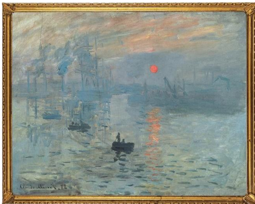
İLL 1. Klod Mone “Təəssürat. Doğan günəş”

Bu söz onların yaratdığı əsərlərə çox uyğun gəlirdi, çünki rəssamlar bilavasitə gördüklərindən aldıkları təəssüratları təsvir edirdilər. Bütün bu fikirləri şagirdlər əsərlər üzərində izləyirlər (Ağayev, 2023: 30).