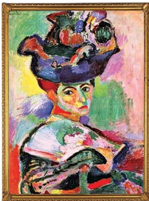
İLL 7. Anri Matis “Şlyapalı qadın”

“Anri Matis: rəngkarlıqda dekorativlik, forma və rəng” mövzusunda ilk növbədə şagirdlərə Parisin rəsm salonlarının birində tanınmış rəssamların əsərləri ilə yanaşı, Anri Matisin də “Yaşıl şlyapalı qadın” əsərinin nümayiş etdirilməsi diqqətə çatdırılır. Portretdən tamaşaçıya yanakı əyləmiş hündür şlyapalı qadın baxır. Onun asimmetrik üz cizgiləri “vəhşi” boyalarla çəkilmişdir. Təsvir real insana o qədər oxşamırdı ki, onun eybəcər görünməməsi mümkünsüz idi. Bu əsər qalmaqallı gurultu qopardı və fovizmin təməlini qoydu. VIII sinif şagirdləri fovizm cərəyanının tarixi və nəzəri əsasları haqqında mühüm məlumat öyrənirlər (9).