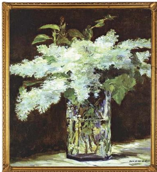
İLL 3.Eduard Mane “Yasəmən dəstəsi”