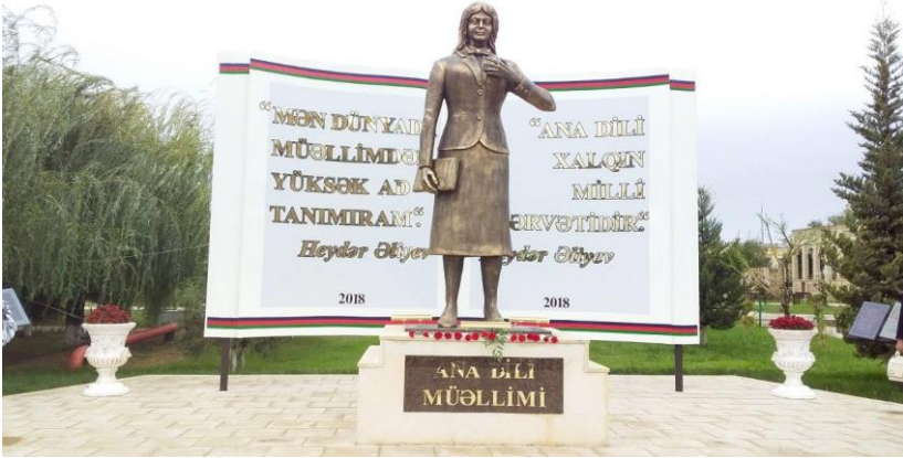
Şəkil1. “Ana dili müəllimi” abidəsi (Xaçmaz şəhəri Çənlibel istirahət parkı).

ərənlərin qəhrəmanlıq dili adlandırılıblar onu. Qanlı döyüşlərdən əvvəl bu dildə oxunan qələbə çağırışlı, döyüş əzmi qəhrəmanlıq nəğmələri bu ərənlərin qalibiyyətinin az qala yarısı hesab olunub. Bayrağının işığına dünyanı toplayanların fateh dili adlandırılıb, dünyanı dolaşan mühacirlərin “vətən dili” deyiblər.