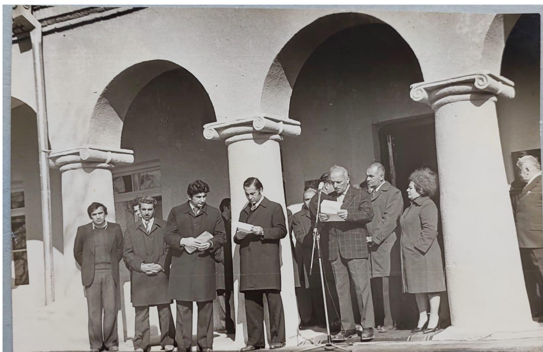
1980-ci il, Muzeyin yeni binasının açılışı