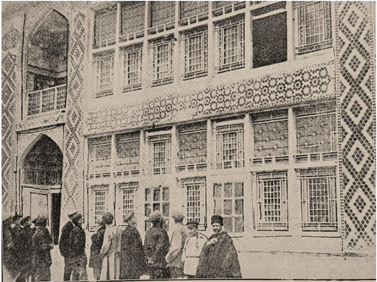
Bağı, içiləri Nyxada Şəki xan sarajını təmizləyirlər.

Bir sözlə Şəkiddə ilk muzey tarix profilli olmaqla 1925 ci ildə yaradılır və Şəki Xan sarayında fəaliyyətə başlayır. 1929 cu ilə aid aşağıdakı fotodan da görüldüyü kimi, möhtəşəm memarlıq abidəsi içərisində yerləşən muzey xalqın sevimli ziyarət-tamaşa yerinə çevrilir.