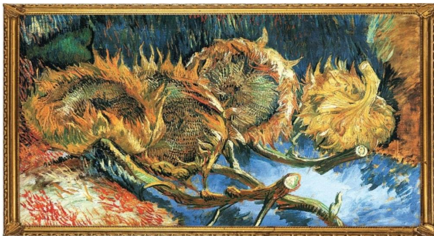
İLL 6. Vinsent Van Qoq “Kəsilmiş dörd günəbaxan”

Dərslərdə həmçinin özünəməxsus parlaq yaradıcılıq üslubu ilə seçilən Vinsent Van Qoqun rəngkarlıqda öz fərdi tərzini haqqında da geniş məlumatlar verilmişdir. Van Qoqun yaradıcılığı Avropa mədəniyyəti tarixində mürəkkəb keçid dövrünü əks etdirir. Onun yaradıcılığı həyata, sadə, zəhmətkeş insana alovlu, çılğın məhəbbətlə doludur. Van Qoqun əsərlərindəki özünəməxsus yaradıcılıq ehtirası, onun ani ifadə qüvvəti və faciəvi coşğunluğu şagirdlərdə maraqlı oyadır (VIII sinif təsviri incəsənət metodik vəsait, 2015: 96).