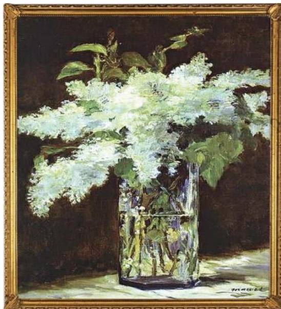
İLL 3.Eduard Mane “Yasəmən dəstəsi”