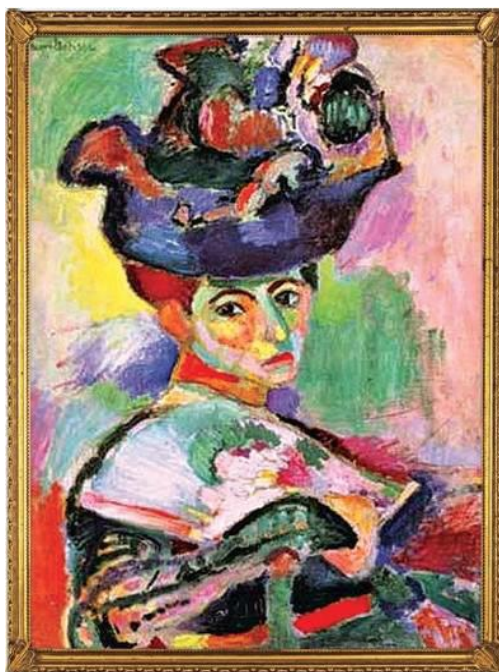
İLL 7. Anri Matis “Şlyapalı qadın”

“Anri Matis: rəngkarlıqda dekorativlik, forma və rəng” mövzusunda ilk növbədə şagirdlərə Parisin rəsm salonlarının birində tanınmış rəssamların əsərləri ilə yanaşı, Anri Matisin də “Yaşıl şlyapalı qadın” əsərinin nümayiş etdirilməsi diqqətə çatdırılır. Portretdən tamaşaçıya yanakı əyləmiş hündür şlyapalı qadın baxır. Onun asimmetrik üz cizgiləri “vəhşi” boyalarla çəkilmişdir. Təsvir real insana o qədər oxşamırdı ki, onun eybəcər görünməməsi mümkünsüz idi. Bu əsər qalmaqallı gurultu qopardı və fovizmin təməlini qoydu. VIII sinif şagirdləri fovizm cərəyanının tarixi və nəzəri əsasları haqqında mühüm məlumat öyrənirlər (9).