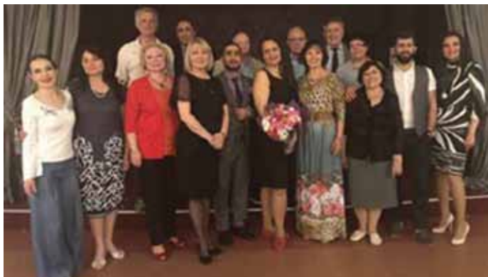
Вместе с комиссией, отметившей заслуги Народного коллектива «Школа кавказских танцев»