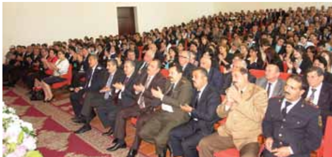
Выступление перед общественностью Бардинского района Азербайджана, где жил и работал до 1998 г.