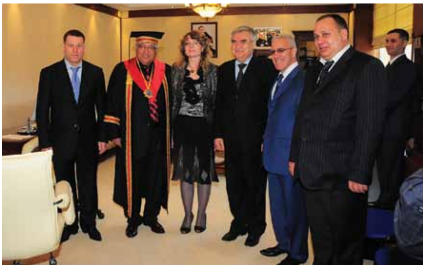
На вручении академику НАН Азербайджана Арифу Пашаеву научного звания – Почетного доктора Одесской академии связи и Почетного члена азербайджанской диаспоры в Украине