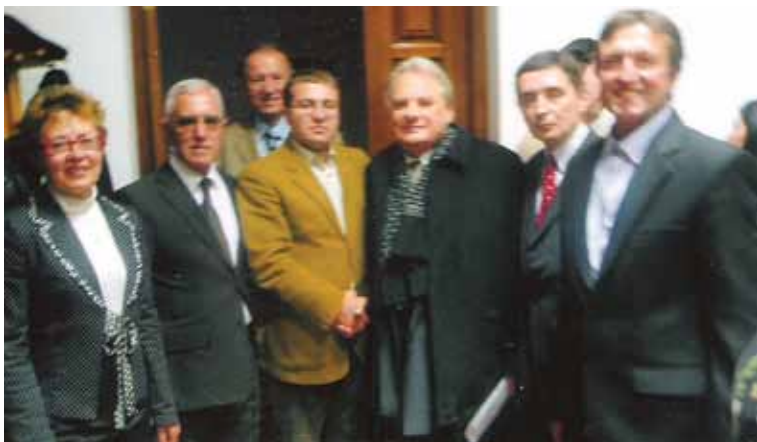
Экс-министр иностранных дел Украины Геннадий Удовенко в окружении друзей азербайджанцев и украинцев после презентации книги Арифа Гулиева