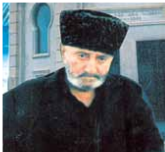
Сейид Юсиф Ага

«Любить азербайджанцев – это гордость, Забывать азербайджанцев – это подлость, А быть азербайджанцем – это честь, Что не у всех народов есть!»