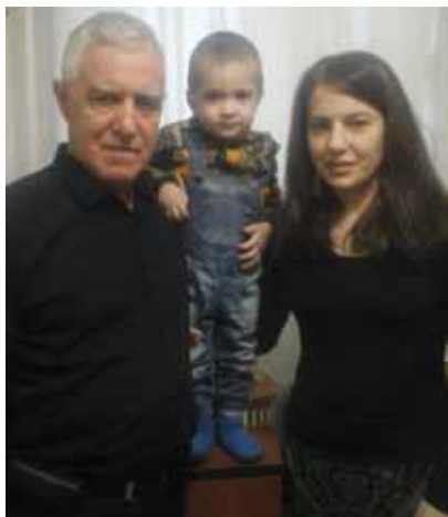
В семейном кругу