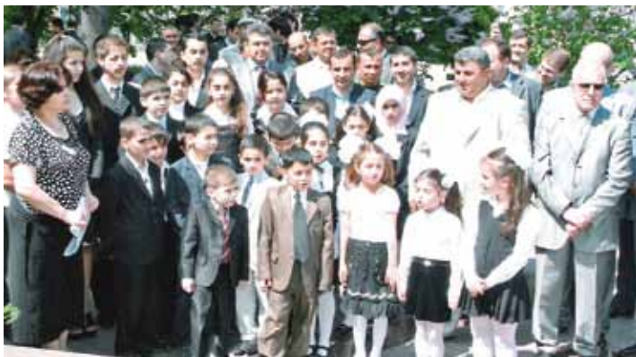
В день рождения Гейдара Алиева. Юные украинские азербайджанцы вместе с родителями на территории Посольства Азербайджана в Украине