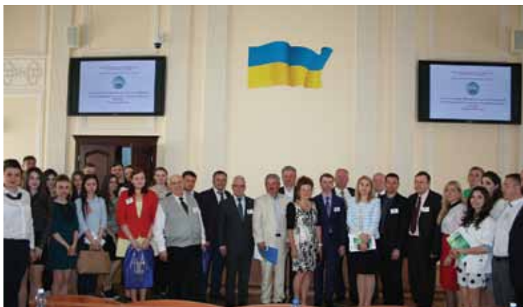
Участники Международной научно-практической конференции «Современные правовые системы мира: тенденции и факторы развития», Киевский национальный университет технологии и дизайна, 25 мая 2017 г.