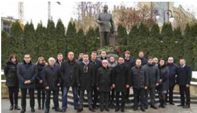
Азербайджанский коллектив «SOCAR» в день памяти общенационального лидера Гейдара Алиева возле его памятника в г. Киеве, 12 декабря 2017 г.