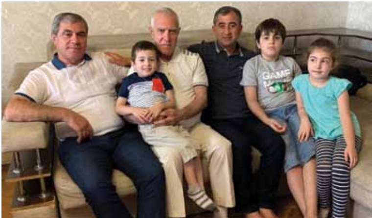
Родные и друзья из села Беюк-Гаджар, киевские и винницкие