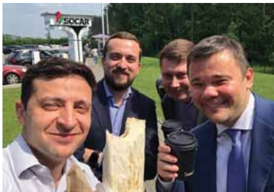
Президент Украины Владимир Зеленский как символ дружбы со своим окружением в Азербайджанской компании «SOCAR Украина»