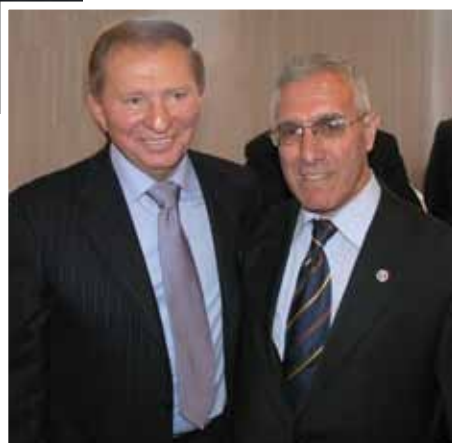
С большим другом азербайджанцев Президентом Украины Леонидом Кучмой во время презентации книги Евгения Кушнарева «Выборы и вилы», 2007 г.