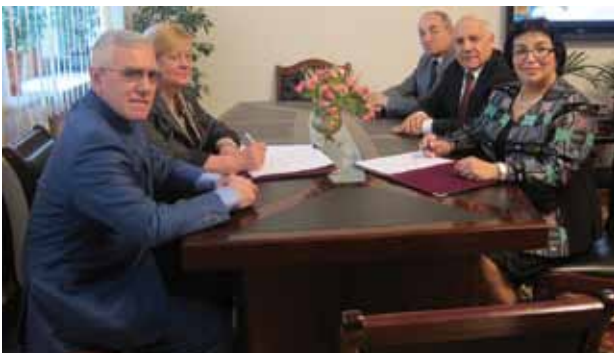
Подписание соглашения о сотрудничестве между Бакинским и Киевским управлением образования, 30 января 2011 г.