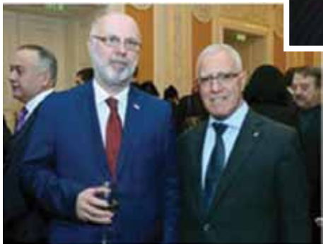
С другом экс-Чрезвычайным и Полномочным Послом Грузии Григолой Катамадзе