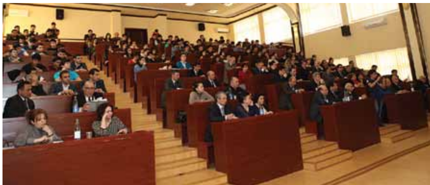
Во время презентации монографии как отчет перед родным университетом спустя 35 лет