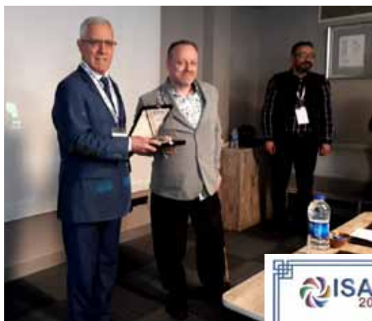
Вручение Сертификата на 3-м Международном симпозиуме по инновационным подходам в научных исследованиях в г. Анкаре, 19–21 апреля 2019 г.