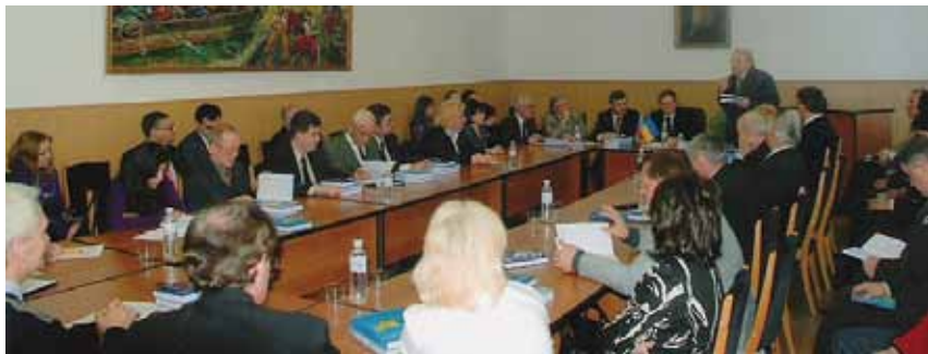
Зал ученого совета Института истории Национальной академии наук (во время презентации)