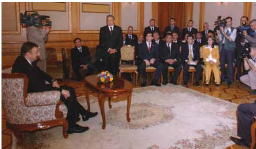
Встреча азербайджанской диаспоры в Украине в первые дни президентства Ильхама Алиева в г. Киеве, июнь 2004 г.