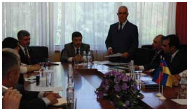
Открытие I конференции общественной организации «Ученый совет азербайджанцев Украины»