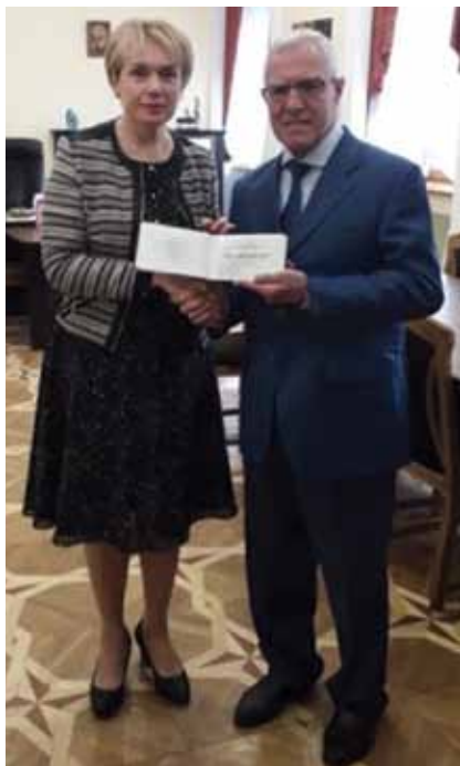
Министр образования и науки Украины Лилия Гриневич вручает Аттестат профессора Арифу Гулиеву