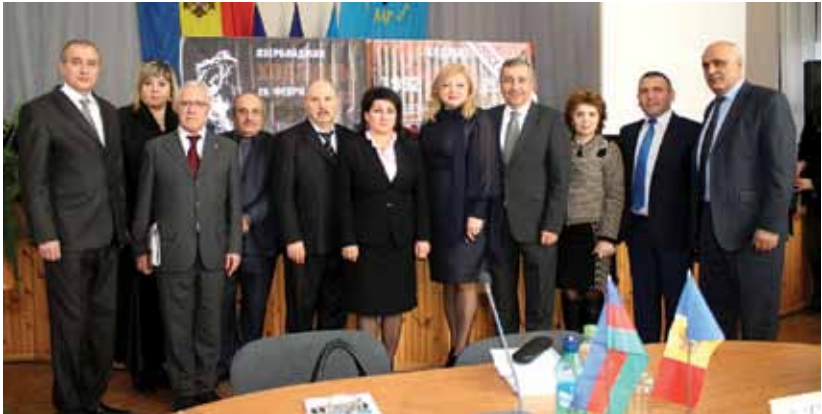
Участники Международной научно-практической конференции «Политика двойных стандартов в разрешении территориальных конфликтов» в Кишинэу, 25 февраля 2016 г.