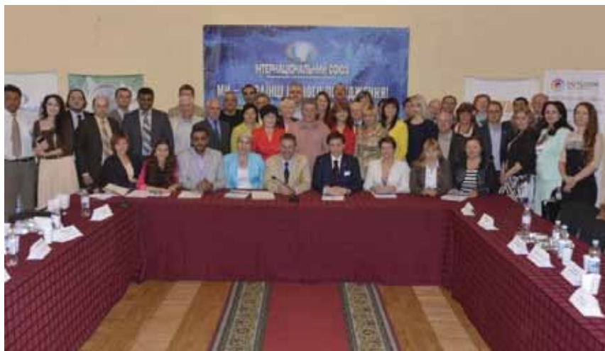
Участники II Всеукраинского форума национальных меньшинств «Мы – единый народ»