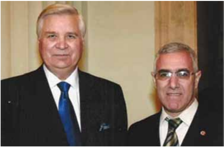
Встреча с Министром иностранных дел Украины Анатолием Зленко