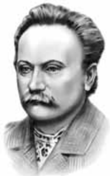
Иван Франко (1856–1916)

«Любить азербайджанцев – это гордость, Забывать азербайджанцев – это подлость, А быть азербайджанцем – это честь, Что не у всех народов есть!»