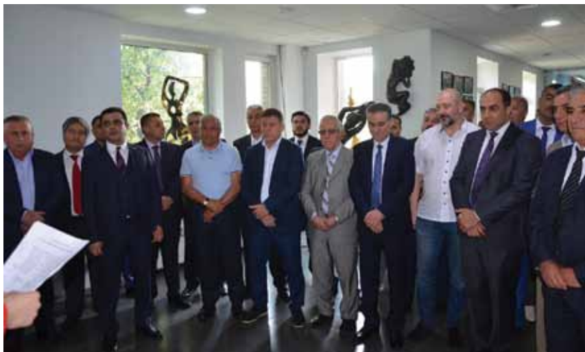
Активисты украинской азербайджанской диаспоры