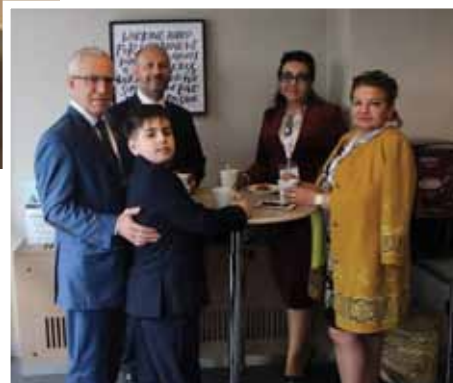
Участники симпозиума в Турции (г. Анкара) из Азербайджана, Турции, Узбекистана и Украины за дружескими чайном столом