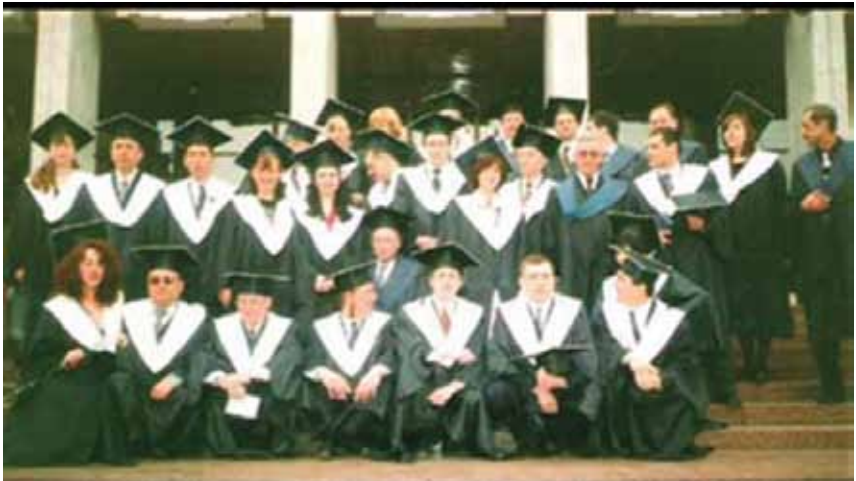
Выпускники Национальной академии государственного управления при Президенте Украины, 28 февраля 2002 г.