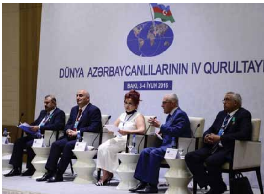
IV Съезд азербайджанцев мира