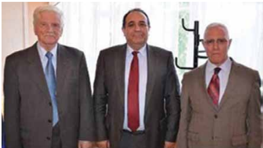
Ариф Гулиев с экс-министром иностранных дел Азербайджанской Республики Вилятием Гулиевым (подписавшим приказ о его дипломатической службе) и другом Чрезвычайным Послом Украины Юрием Кочубеем