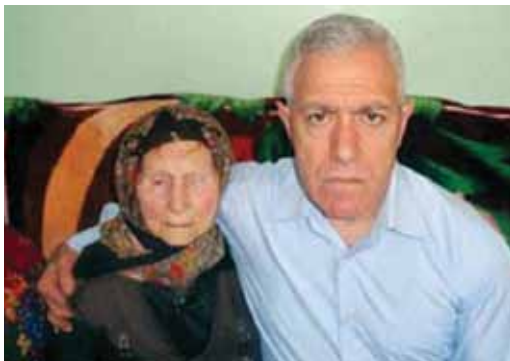
Последняя встреча с мамой