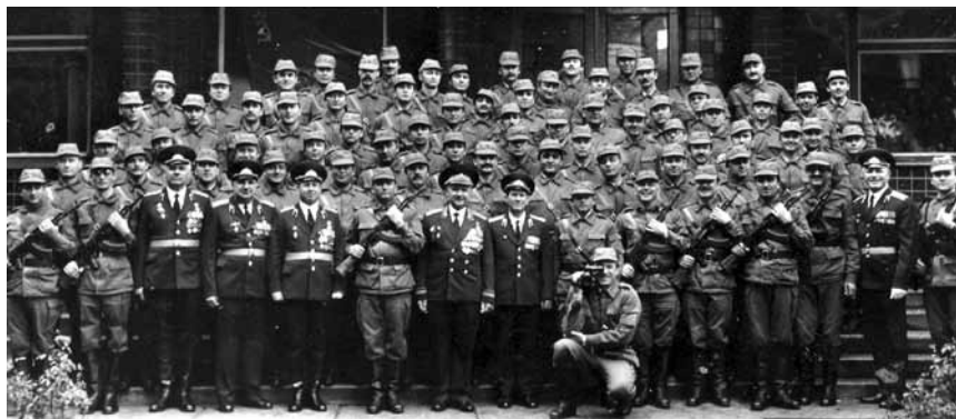
Первое окружение в Киеве: слушатели 10-го курса Суворовского училища, сентябрь – октябрь 1989 г.