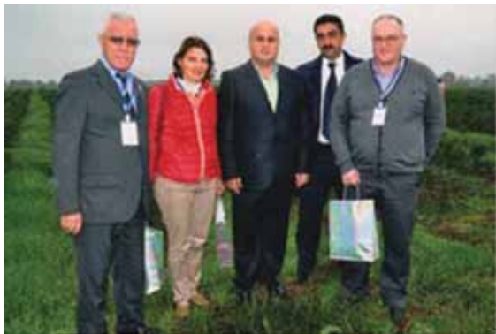
Участники IV Бакин-ского международного гуманитарного форума на чайных плантациях в Азербайджане, г. Ленкоран