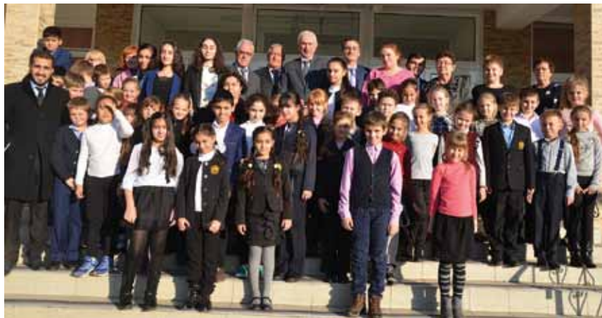
Ученики азербайджанских классов после торжественных мероприятий в честь 25-летия независимости Азербайджана