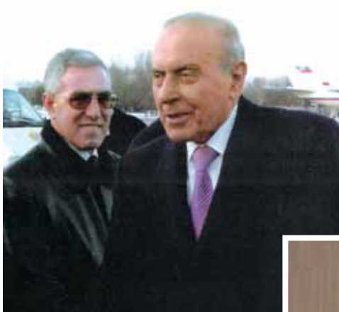
Последняя личная встреча с Гейдаром Алиевым в Бориспольском аэропорту в г. Киеве