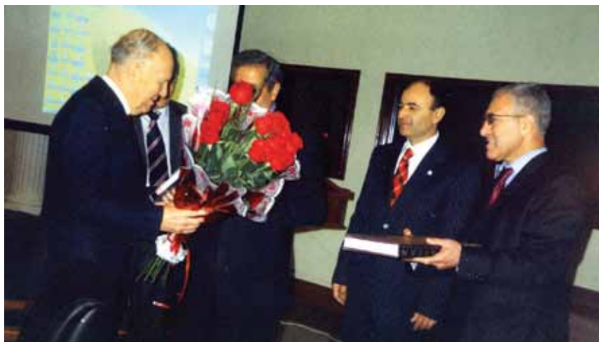
Поздравление с днем рождения Президента НАН Украины Бориса Патона