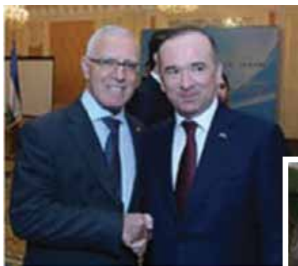
С другом Чрезвычайным и Полномочным Послом Республики Узбекистан в Украине Алишером Абдуалиевым (ныне первый заместитель министра инвестиции и внешней торговли Республики Узбекистан)