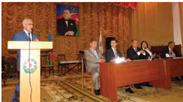
Отчет перед земляками в честь 90-летия Гейдара Алиева, май 2013 г.