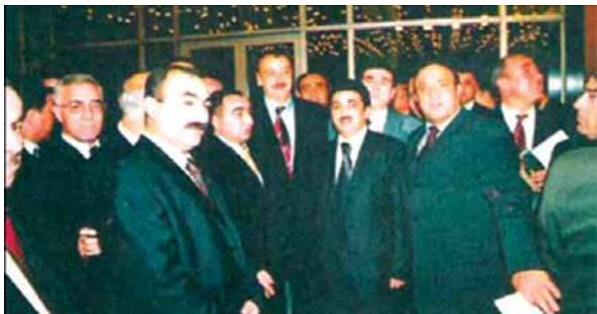
Делегаты I Съезда азербайджанцев мира в окружении будущего Президента Азербайджана, 2001 г.