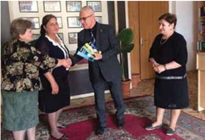
Отчет родной Бардинской электронной библиотеке