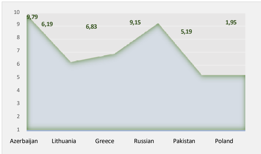
Cədvəl 2. Bərpa olunan enerji və iqtisadi səmərəlilik ÜDM-un indeks